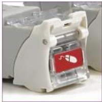
Opción con puerta