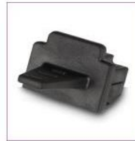
Inserto ciego para panel