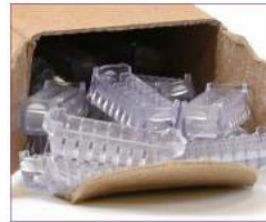
Tapas de terminación