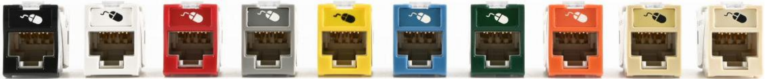
Negro Blanco Rojo Gris Amarillo Azul Verde Naranja Marfil Marfil claro