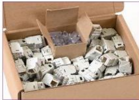
Empaque a granel Eco-amigable