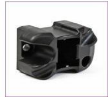
Inserto de protector de palma